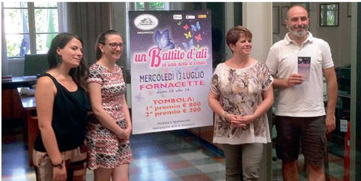
GLI ORGANIZZATORI Alla riuscita della serata hanno contribuito commercianti, Af e amministrazione