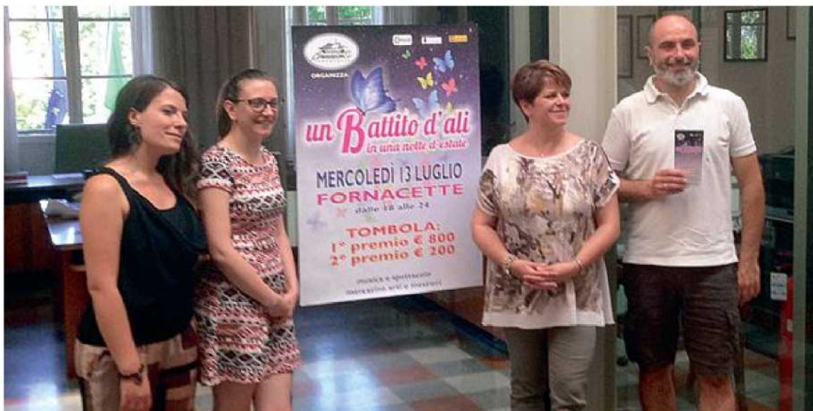
GLI ORGANIZZATORI Alla riuscita della serata hanno contribuito commercianti, Af e amministrazione

DALLE 15.30 FINO A TARDA SERA, OGNI ANGOLO SARA' ILLUMINATO DA GIOCHI DI LUCI COME FARFALLE