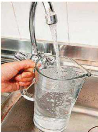
Problemi in arrivo per tre giorni

Lavori di manutenzione alla rete idrica fino a venerdì