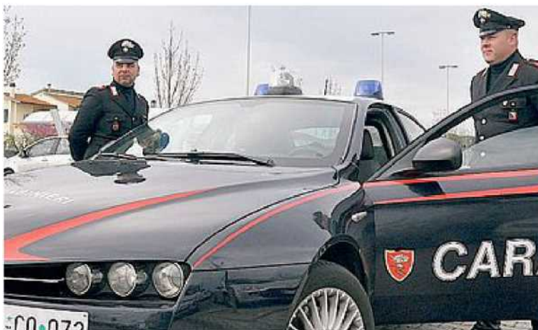
CACCIA AI BANDITI I carabinieri stanno indagando sull'ennesimo furto alle macchinette