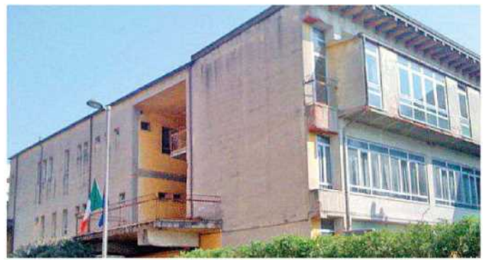
La sede dell'ex Istituto professionale in via Primo Maggio