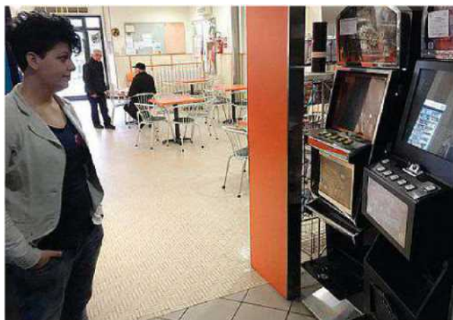
Le slot machine prese di mira dai ladri

Una volta entrati - la casa si trova lungo la via Vecchia Provinciale - hanno rubato numerosi oggetti d'oro. I furti sono stati denunciati ai carabinieri delle varie stazioni, presenti sul territorio e che si occupano anche delle indagini. (s.c.)