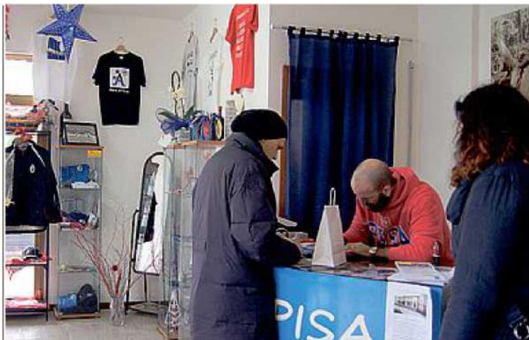
SACCHEGGIO Il negozio di Fornacette colpito dai ladri