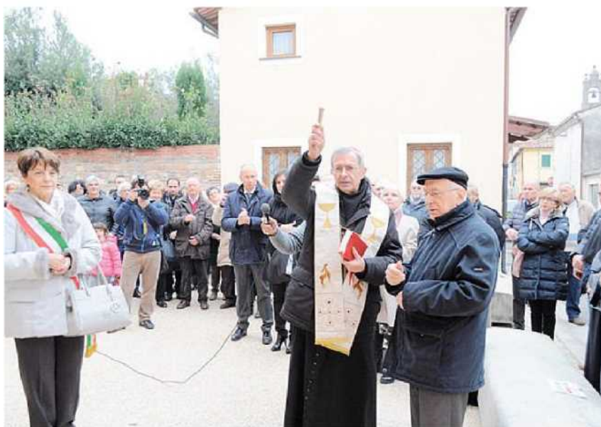
Un momento della inaugurazione del Museo della ceramica a Calcinaia con la benedizione di monsignor Giovanni Paolo Benotto