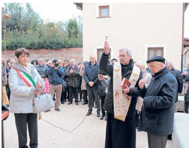
BENEDIZIONE Ieri mattina l'inaugurazione del museo della ceramica