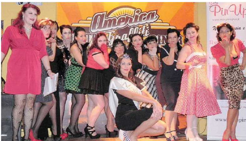
Il gruppo delle partecipanti al concorso