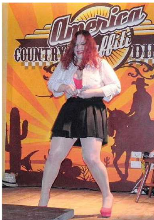
Una delle esibizioni