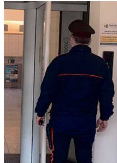
INDAGINI IN CORSO Un carabiniere all'ingresso della banca