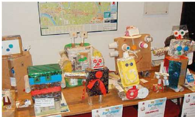
Alcuni dei robot ecologici in mostra al Municipio di Calcinaia

Un esercito di robot amici dell'ambiente ha invaso l'atrio del Palazzo Comunale. Un'invasione pacifica ed ecologica quella che ha per protagoniste le opere realizzate dai bambini delle scuole elementari di Calcinaia e Fornacette nell'ambito di alcuni laboratori sul riciclo ispirati al film "Wall - e". L'esposizione è il frutto del percorso educativo realizzato dall'amministrazione comunale, in collaborazione con l'Associazione Fratelli dell'Uomo e gli istituti scolastici interessati, nell'ambito del progetto "Parliamone". Gli studenti delle classi III A, III B, IV A, IV B, V A, V B della scuola primaria di Calcinaia e V A, V B e V C della scuola primaria di Fornacette hanno visto il film sul robot incaricato di ripulire il pianeta Terra. Culmine del percorso i laboratori creativi in cui sono stati realizzati, rigorosamente con materiali di scarto a cui è stata data una seconda vita, i robottini artistici da oggi esposti nell'atrio del Comune. La mostra, dal titolo "Ricicla l'arte e mettila da parte", rimarrà visibile fino al 14 marzo.