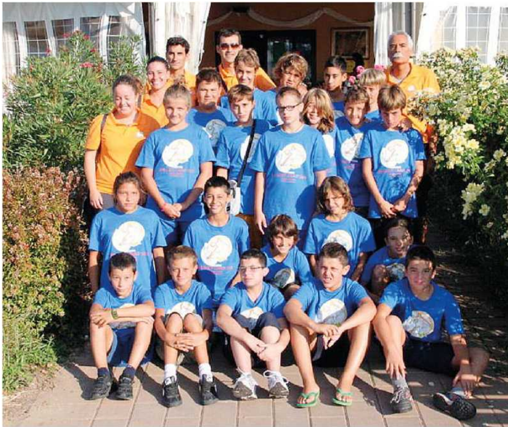
Un'immagine del Camp estivo della Ies