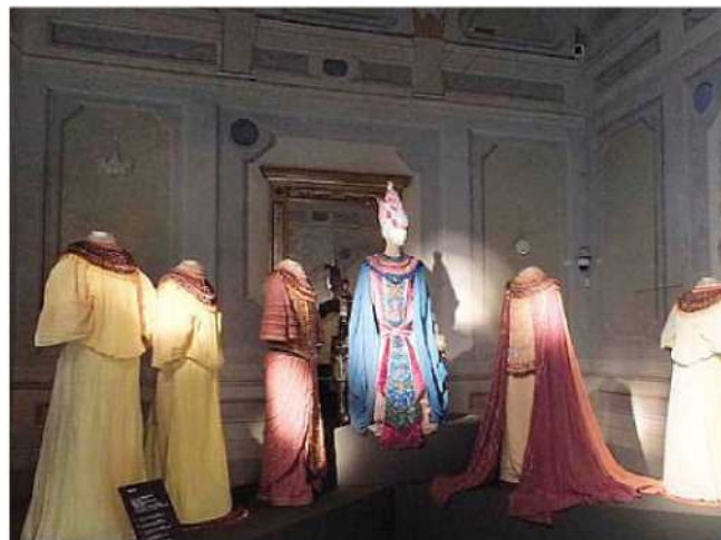
Abiti in mostra alla fondazione Cerratelli

Infine, per assaporare da vicino il mestiere del costumista creatore di costumi per la scena, la Fondazione propone per le scuole dei laboratori didattici. Subito dopo l'anteprima dell'inaugurazione di domani, venerdì 5, alle ore 19 si terrà la presentazione del libro "Viaggio in Toscana" con la presenza del Governatore della Toscana Enrico Rossi con una intervista del giornalista Marco Barabotti.