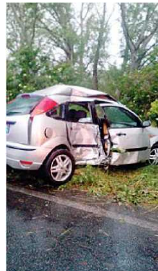
La fiancata distrutta