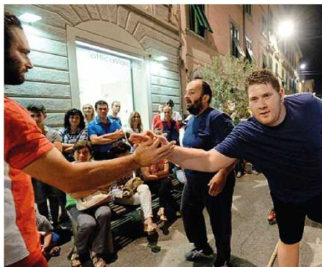
Il saluto prima della sfida