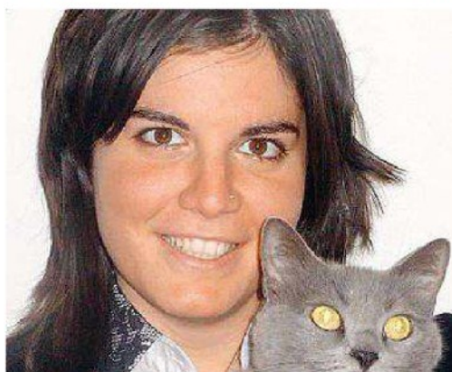
Sopra la giovane consigliera regionale del Pd insieme al riconfermato governatore della Toscana Enrico Rossi; a sinistra in un selfie con il proprio gatto